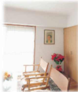
④日当たりの良い 広接スペース