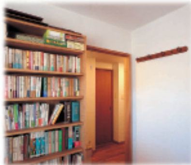
②書斎の造り付け本棚 入口はドアから引戸 に変更