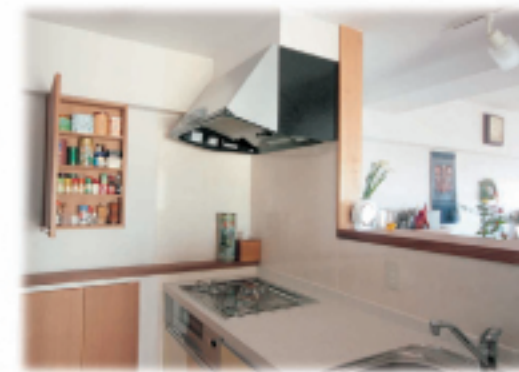
⑩機能的なキッチン ダッキオープンも 使えるコンロ