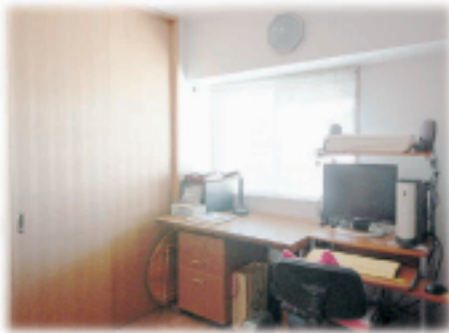
③天井までの収納で部屋は すっきり片付きました (カウンター：ムク材)