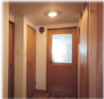
①ゆったりした玄関ホール 自然素材を多用 収納も充実させました