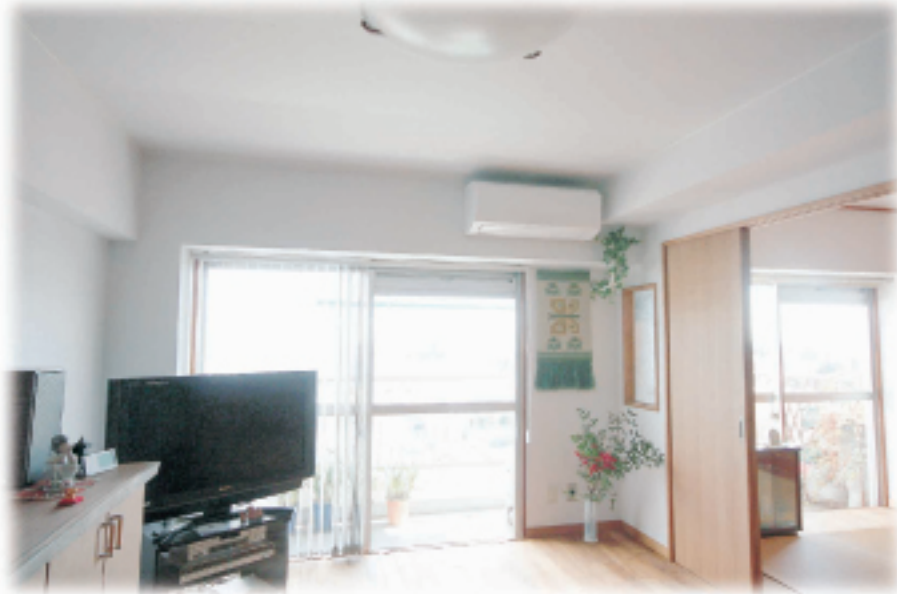
⑤間仕切りの開口を広げ2部屋をワンルーム に出来るようにしました 明るく眺めも良くなり変えました