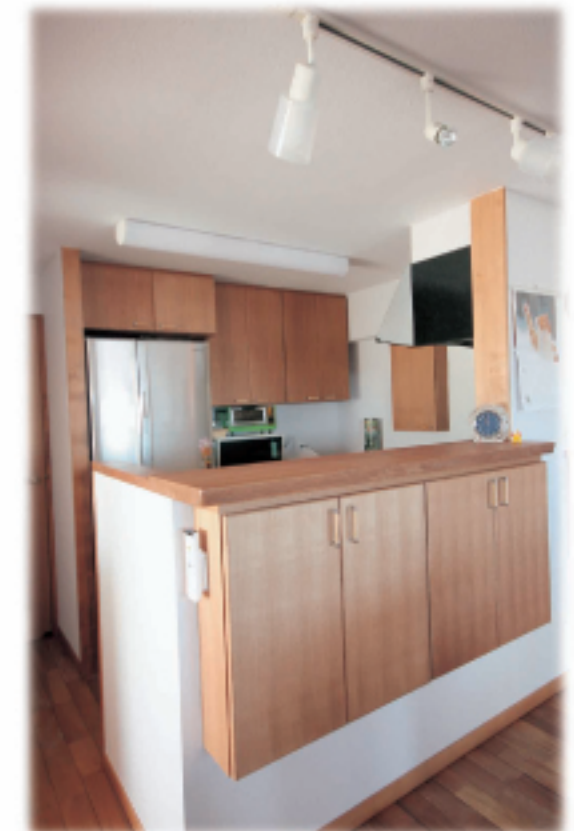
⑦対面式キッチン カベ厚を 利用しないカウンターと収納 (ムク材)