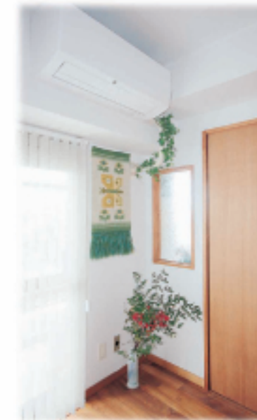
⑥居間コーナーは ガラス窓もつけ グリーンスペースに