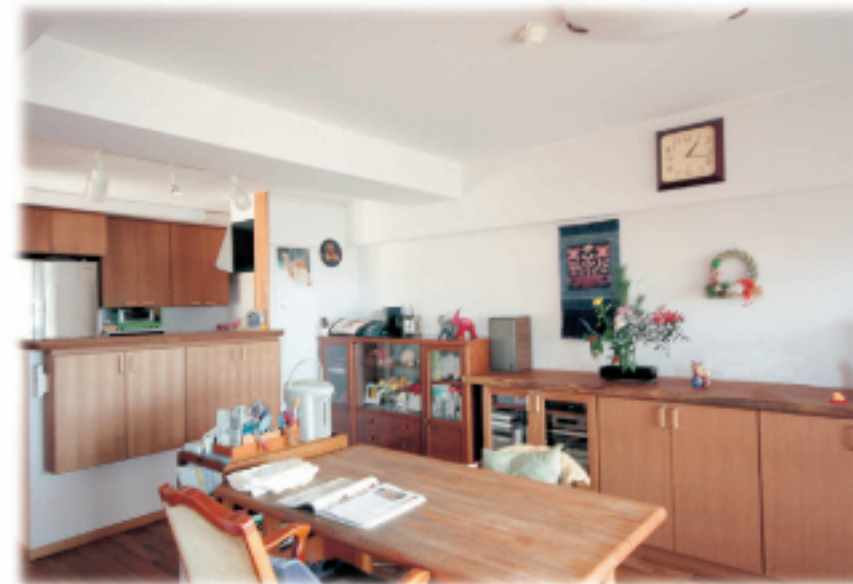
⑨居間は床暖房を設置 全体を広く見せる為にムクカウンター家具は 広く通りました