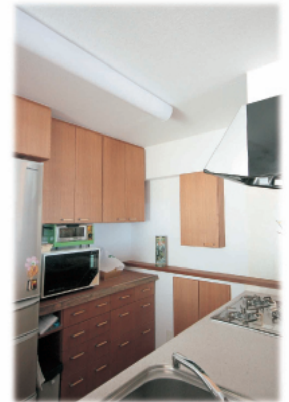
⑧キッチン ムクカウンターと吊り戸棚 引出収納、浅い収納等 物を 出さばい工夫をしました