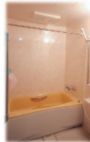
⑩引戸タイプの ユニットバス