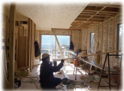
⑤大工さんも泊りがけで頑張ります。天井の仕上げは赤松無垢、羽目板貼り、床はナラ無垢材仕上げ