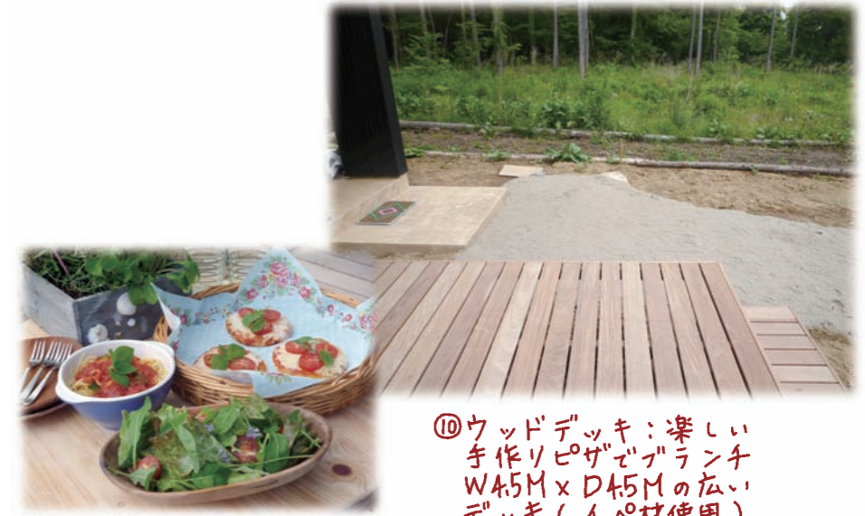
⑩ウッドデッキ：楽しい手作りピザでランチ W4.5M×D4.5Mの広いデッキ（イボ材使用）