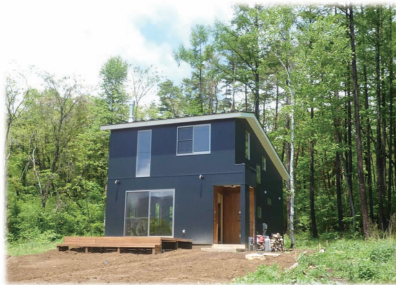
⑩眠っていた木々が目を覚ました頃はウッドデッキも仕上がりました。外壁は断熱材入りガルバリウム鋼板仕上げ