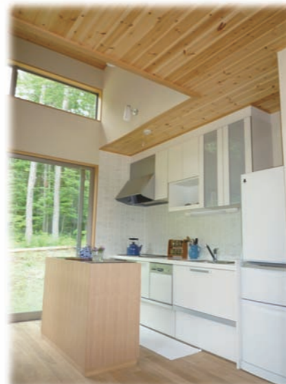
⑦吹抜けの下にI型キッチン 開口はI型を使用 家電収納兼用の間仕切り 家具カウンターを作りました