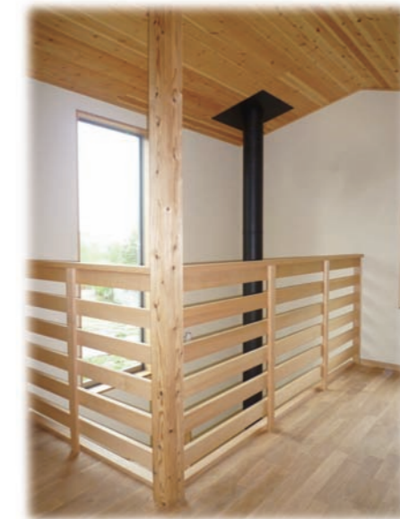
⑧2ヶ所ある吹抜けを風が通り抜け四方の眺めを楽しめる開放感いっぱいの設計