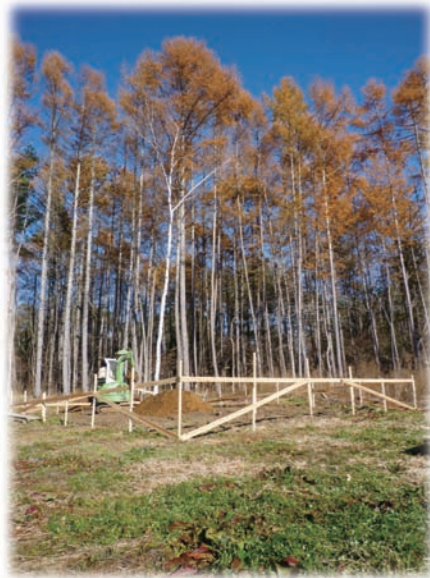
①から松の紅葉が美しい小春日の中ごやりの工事が始まりました