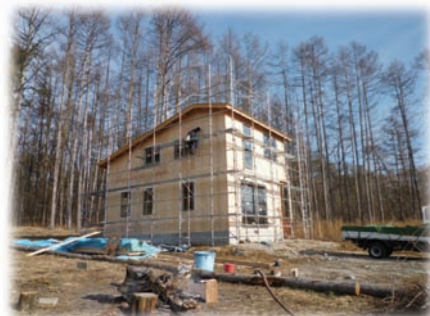
④窓サッシが入り外壁下地が完成でこれから内部の工事