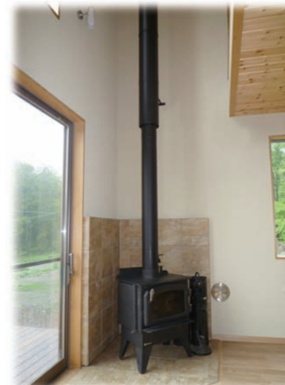
⑨寒冬用の薪ストーブも設置 吹抜けにまっすぐ伸びる煙突はインテリアの中心です 壁は珪藻土仕上げ