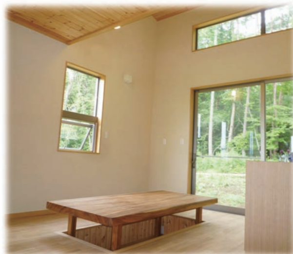
⑥吹抜け上の窓から木立が高く見えます モンキーポット無垢材の楕円ゴタツ 1.1M×2.1M 開口部のガラスはLow-E使用(表面参照) 床暖房は電気式を使用