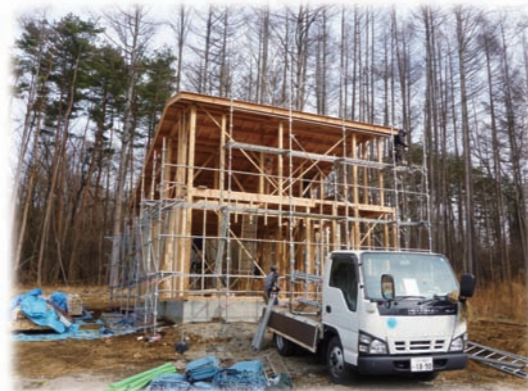
③から松もすっかり葉が落ちた初冬に上棟