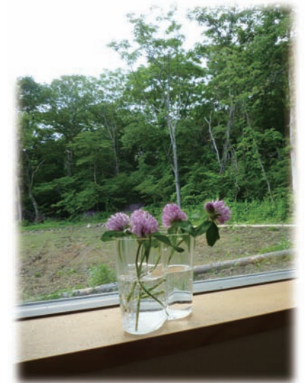
⑨窓から見える緑と自生の赤つめ草