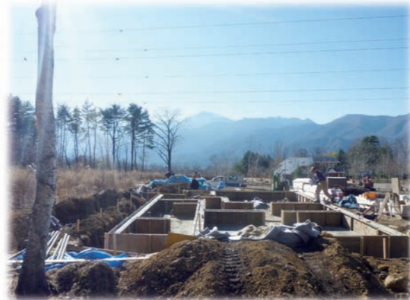
②冬の甲斐駒を見ながら基礎工事