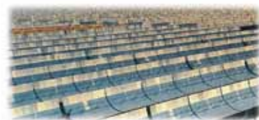
映画「第四の革命」より

福島第一原発事故を受けメルケル独首相は2020年までにドイツ国内の原子炉17基の閉鎖を決定しました。その後押しをしたドキュメンタリー映画「第四の革命-エネルギー・デモクラシー」は事故後ドイツのテレビで緊急放映され約200万人以上視聴し、ドイツの原発に強い影響を与えました。第四の革命とは第一は農業革命、第二の産業革命、第三のIT革命に続くエネルギー革命です。この映画は日本でも公開され100%再生可能エネルギーへのシフトが可能で、かつ必要だという熱いメッセージが観る人に伝わってきます。