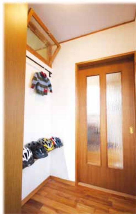
玄関廻りはリビングに入る建具の位置を変更し、ドアから引き戸にも変更しました。引戸はアンティーク調の気泡入りガラスを選び、建具枠も無垢材です