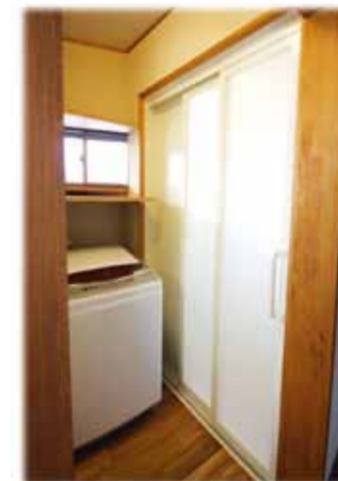
浴室ドアは2枚引き戸にして開口面積を広く取ったので、老後も安心ですね