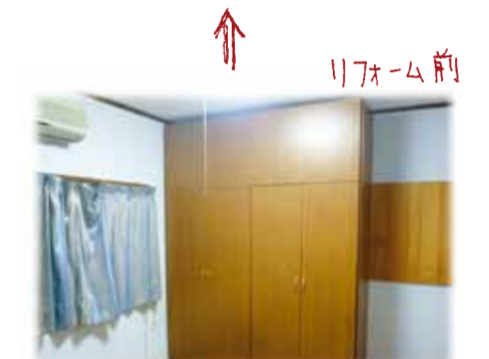
子供部屋にひくところは、作り付け家具で窓を塞がれ壁と天井のビニルクロスは、う、とうしい感じでした