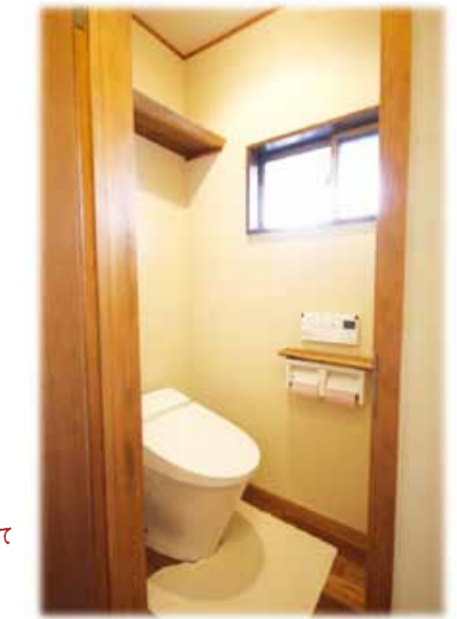
トイレにも消臭効果のある珪藻土を使用しパーペーホルダーと棚板には一枚板の銘木を使用