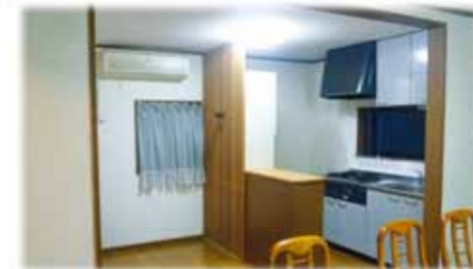
リフォーム前はビニルクロスと複合フローリングのお部屋でした