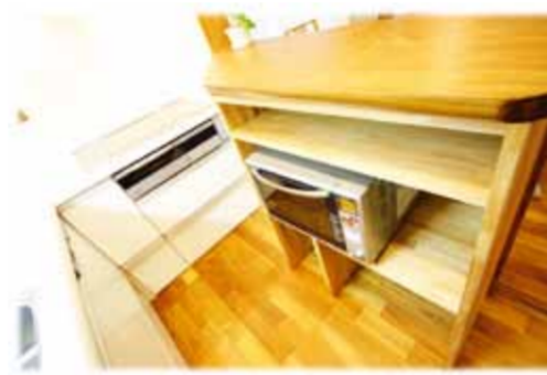
お手持ちのオーブンに合わせてキッチン収納を作りました。カウンターにはお客様と選びに行った一枚板の銘木材を使用しました