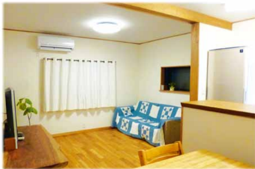
キッチンは南側の部屋に位置を変更し床暖房を敷き無塗装のチークの無垢材フローリングをドイツの自然オイルで仕上げました。ビニルクロスを使用せず天井にはドイツの紙クロスを使用壁はセルフビルドでスイスから輸入した塗り壁材を使用しました