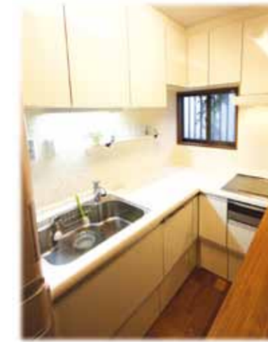
キッチンの壁は大理石のモザイクタイルを使い白く明るく仕上げました。