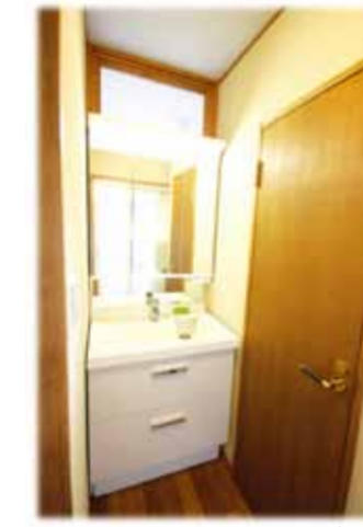
洗面脱衣所廻りには、湿気対策として珪藻土を塗り洗面化粧台には玄関からの光と風が通るように内側しほを取付け