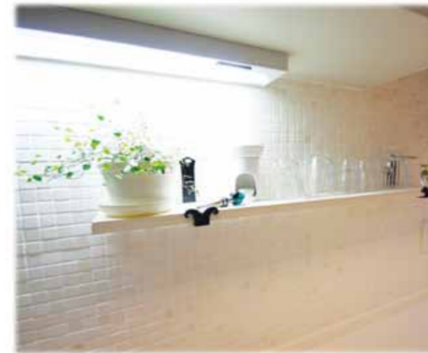
手造りアイアンで作った棚受けに白い棚板をセキョット趣びを出してみました