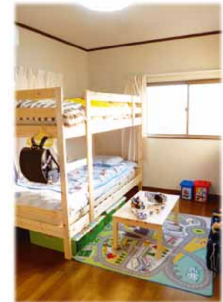
作り付けの家具を撤去したので部屋が明るくなり壁には珪藻土も天井にはドイツから輸入した紙クロスを使い見違えるようになりました