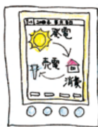
室内からモニター

何でも節約、節約というと我慢ばかりで気持ちが暗くなりがちです。それを無理をせず、しかも楽しみながら実行出来れば...というものを探してみました。