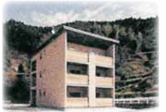
おおとよ製材社員寮 (高知県)

つくばCLT実験棟の本体が建ち上がるのにかかった日数が十日足らずとは驚きでした。建物の重量感と空気の優しさが際立っているのが印象に残りました。オリンピックの新国立競技場に使用される予定。環境に優しく高性能なCLT住宅が日本で広がることを期待しています。