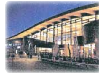
大規模ショッピングモール (オーストリア)