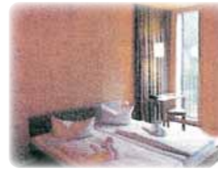
BMWホテル (オーストリア)

カナダ・アメリカ、ヨーロッパで規格作りや実際の建物が建てられ各国で急速な伸びをみせています。