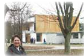
つくば市のCLT実験棟を背景に

CLTとは集成材(断面寸法の小さい木材を接着剤で貼り合わせた木質材料、主に建材やテーブルの天板、家具素材として使う)を板の方向が層ごとに直交するように重ねて性能を更に高めた大判の1枚板です。厚み3層〜7層(3cm/層)幅2m×長さ6m、我が国でも設計基準が策定されたのをきっかけにCLT材の使用が進みます。