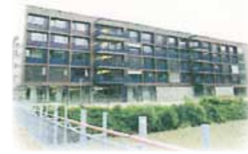
5階建て高齢者施設 (オーストリア)