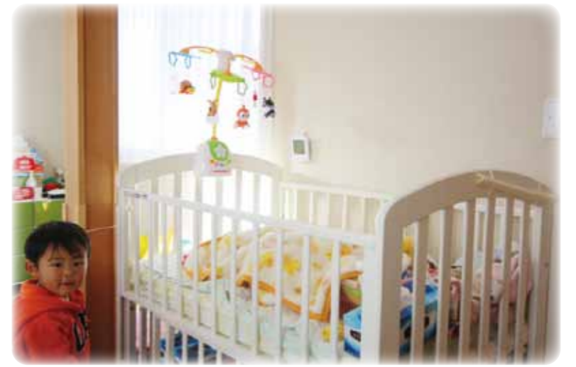
ボクの妹で～す リビングの一角はベビーベッドスペースです