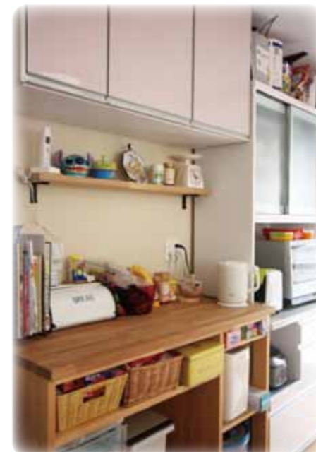
キッチン背側の造作収納と お手持ち食器戸棚と組み合わせ