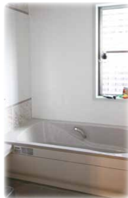
1600×2000の広いユニットバスは 家族一緒に楽しいお風呂タイム