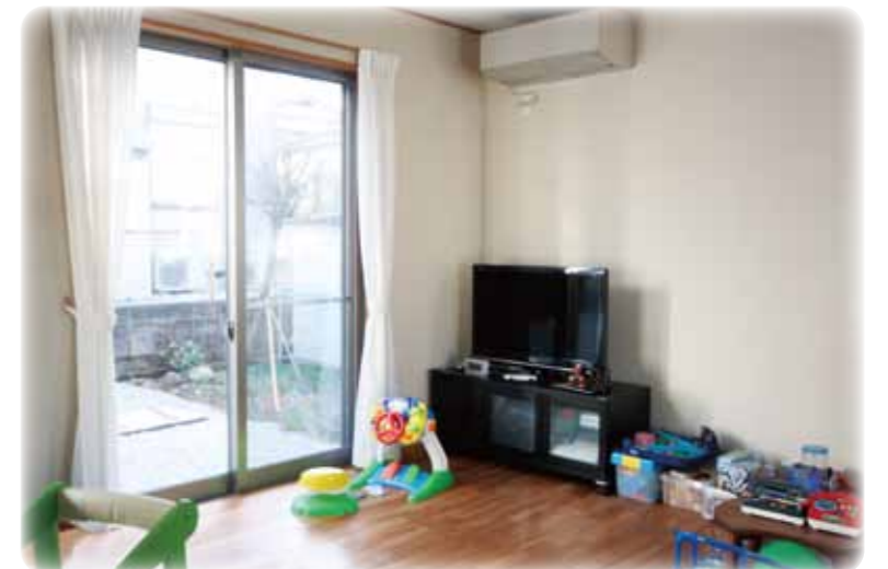
日当たりの良い広い居間は子供達の遊び場です 珪藻土の壁はセルフビルドで頑張っていたいただきました 床：ムク材