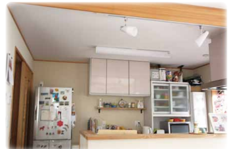
対面式のキッチンで子供達と楽しい時間を 過ごせます