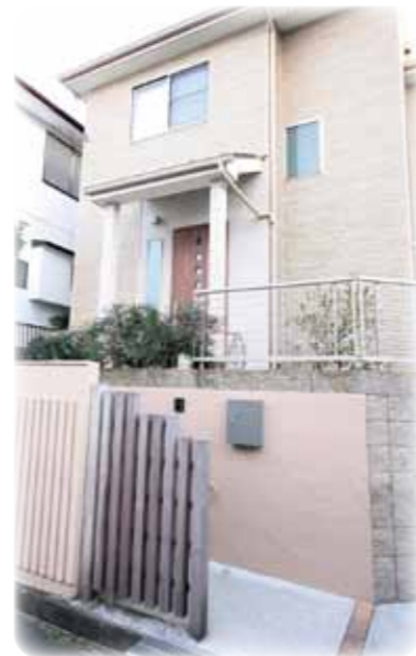
木製の柵はアクセントに