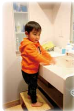
ひとりで 歯みがき 出来るよ!