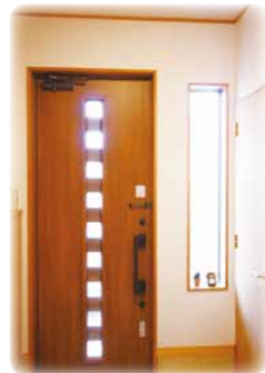
広い玄関ホール 右側は ベビーカーや買い置きスペース