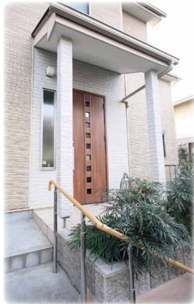
日野市T様邸玄関アプローチ

子育てを中心に考えてプランしました 自然素材をふんだんに使って自由に遊べる 安心の家です