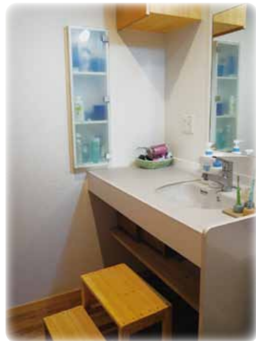
洗面カウンターは長身のご家族にあわせ高さ90cmに スペース・エムの木工教室でお父さんが作った踏み台はとても便利