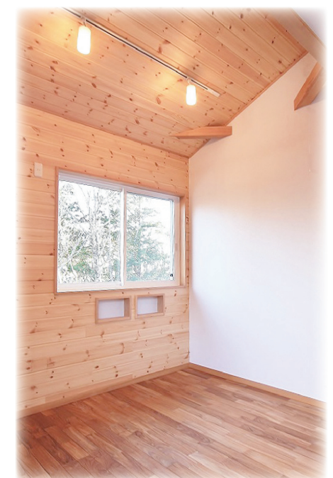
ベッドサイドに小さなニッチ。2Fは勾配天井と空間を大きくデザイン。