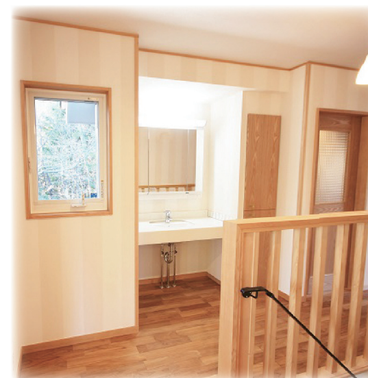
階段ホールの窓から北側の林の緑がきれいです。