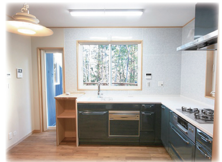
洗剤前の大きな窓からウッドデッキと林を眺めグリーン色のシステムキッチンが外と調和しリゾート感が増します。