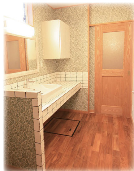
1F洗面所はシャット気取、圧巻回気です。