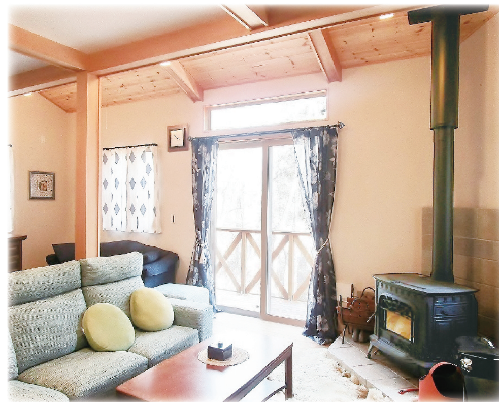
メインのストーブを囲みながら自然を満喫できるリビング。