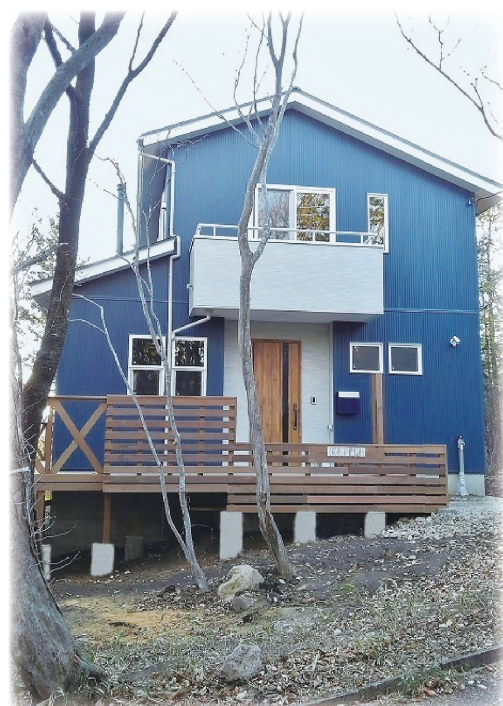
玄関はウッドデッキに繋がります