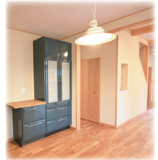
システムキッチンと組合せた食器収納。(タカラスタンダード製)