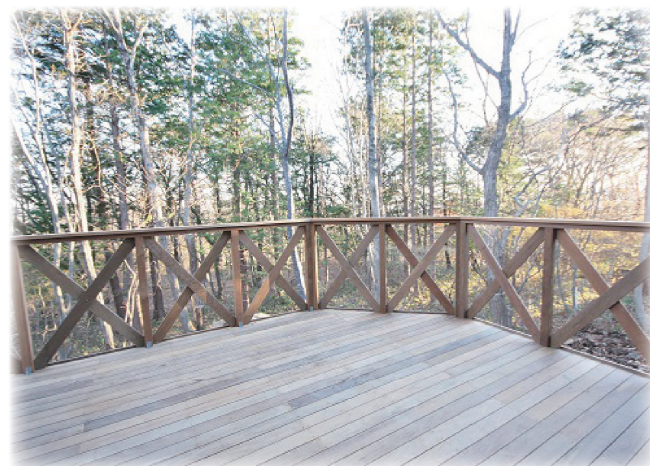
林を見下ろす広いウッドデッキで朝食をどうぞ!!