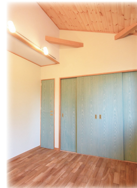
ブルーグリーンの建具は個性的に遊びました。