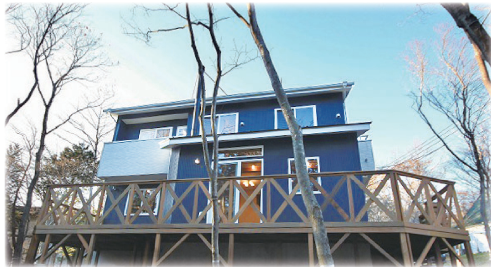
傾斜地を有効に利用したデザインです。